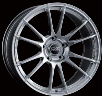
COLOR: CRYSTAL TITAN