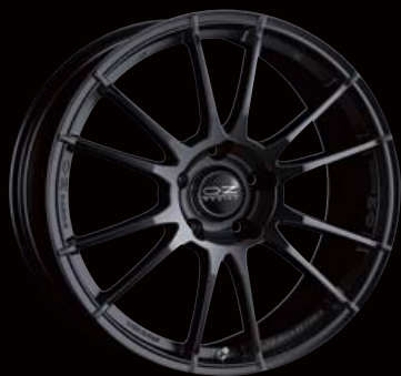
COLOR: MATT BLACK