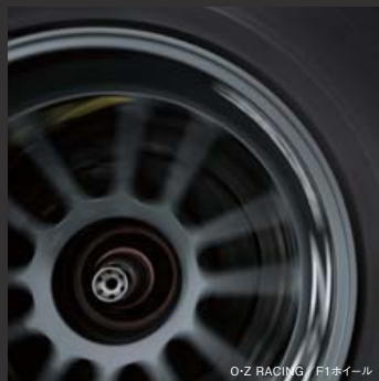
O-Z RACING / F1ホイール