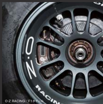
OZ RACING / F1ホイール