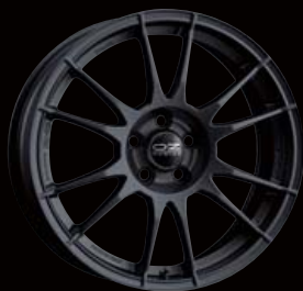
COLOR: MATT BLACK