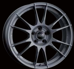
COLOR: MATT GRAPHITE SILVER