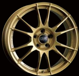
COLOR: RACE GOLD