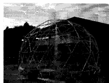
第23回 木製ドームと噴水