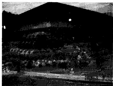
第21回 ビニール傘によるオブジェ